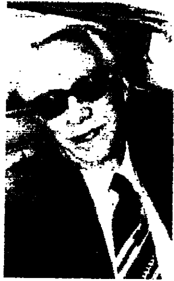
الأمين العام المساعد